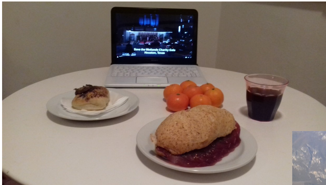
Ostello di Rovereto