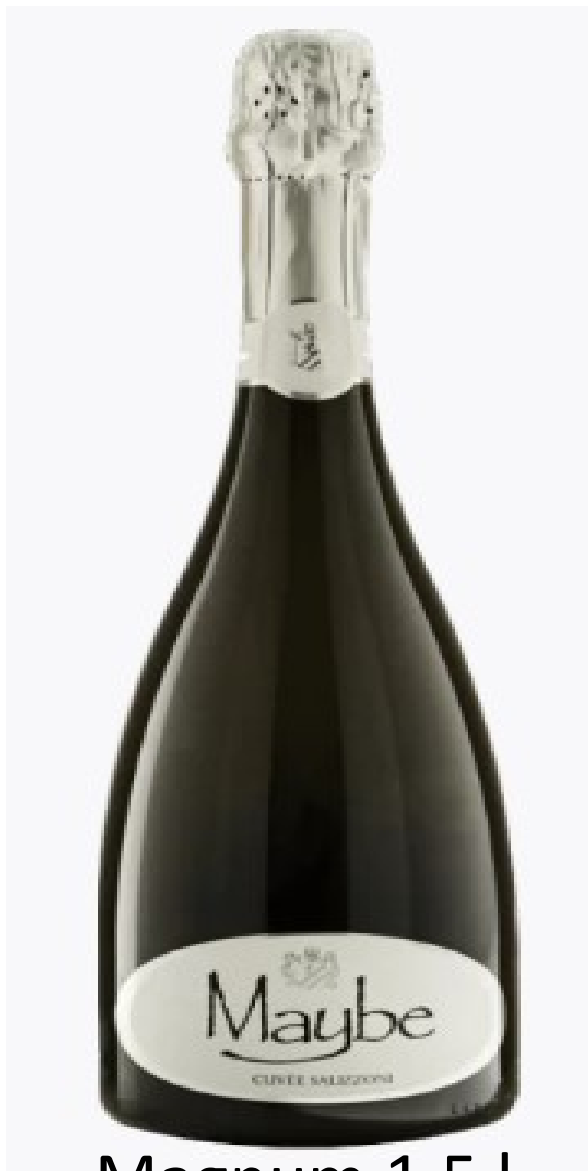
Magnum 1,5 l